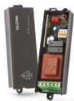
T10 TANGO/ NOIRE/ FM Receptor 433.92 MHz integrado (37códigos).