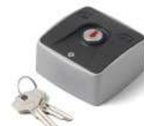
SME2 Selector metálico a llave de superficie.