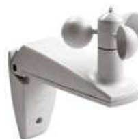
SW01 Sensor de viento.