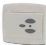
WIN 3 TANGO Emisor mural. Dos canales, con botones de subida, bajada y stop. Pila de litio. Freq. 433,92MHz. Autoaprendimiento.