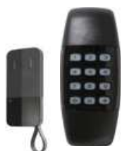
FM TANGO NOIRE